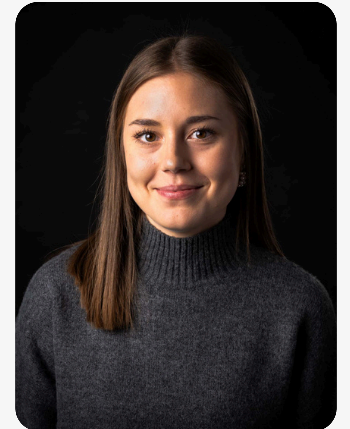
Responsable communication Pôle communication