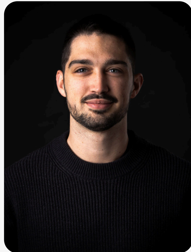
Associé Formateur RS Chef de projet com