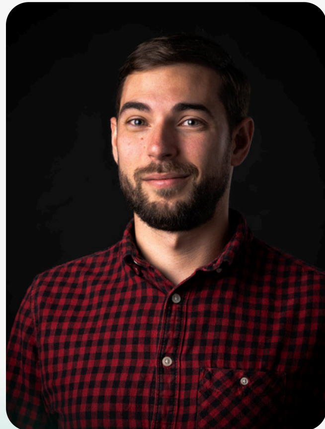
Associé Formateur SEO Chef de projet Technique

Origin Creative Agency est une équipe de 5 personnes dont les compétences sont mises en œuvre pour la réussite de votre projet.