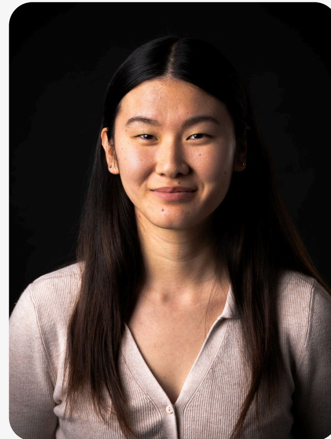
UX / UI Designer Pôle web