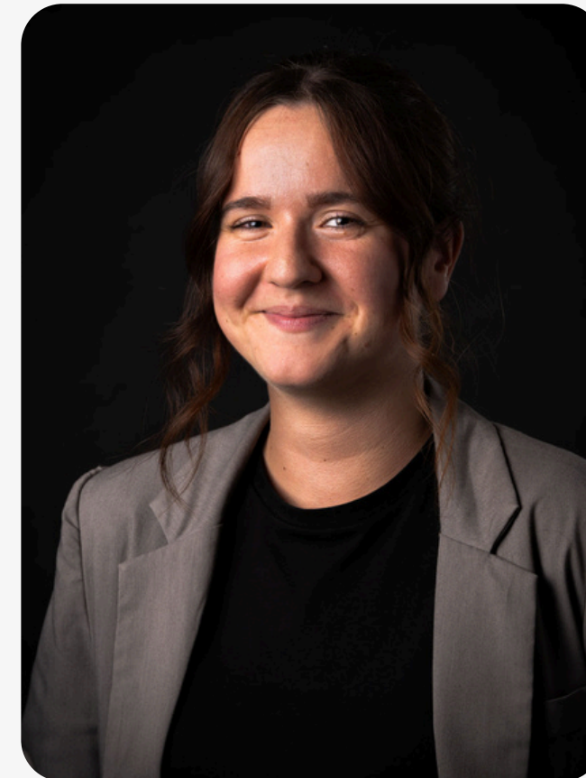
Graphiste Webdesigneuse Pôle Web